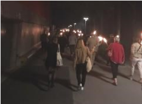
Retraite aux flambeaux