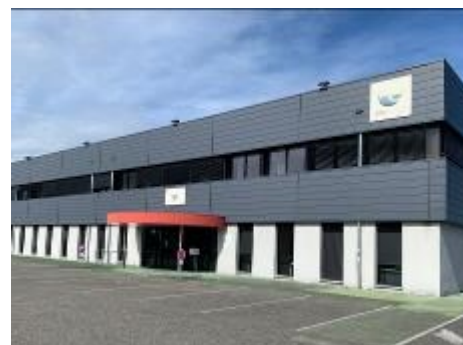
Agence Montauban Nord