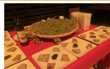
Banquet préparé par l'ESAT Les Ateliers d'Alba