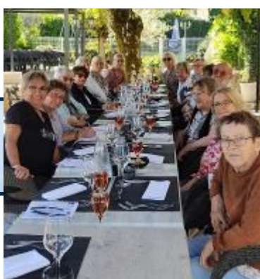
Le Délice des papilles MONTRICOUX