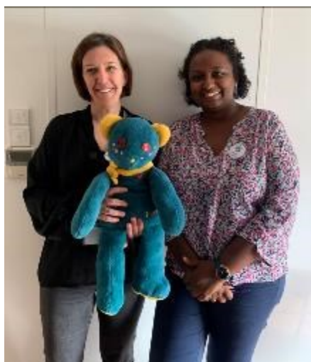
TEAM MONTAUBAN NORD