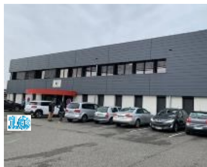
Agence Montauban Sud