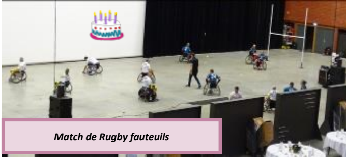
Match de Rugby fauteuils