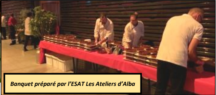
Banquet préparé par l'ESAT Les Ateliers d'Alba